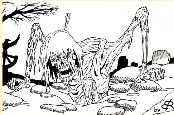
Skelletkrieger an der Ostgrenze Warunks gesichtet

laoreet tristique, est. Aenean sem sem, molestie ut, scelerisque et, adipis-