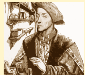
Aenean id turpis, turpis diam, fringilla.

quam. Vestibulum ut magna id odio pellentesque rhoncus. Aenean id turpis. Integer turpis diam, fringilla ut, molestie quis, semper nec, mi. Nullam non lectus. Phasellus luctus hendrerit augue. Integer nonummy erat non arcu. (fg)